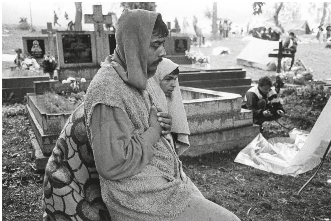
▲ Romská pouť, 1998–2018, Gaboltov, Slovensko. F 9/2019