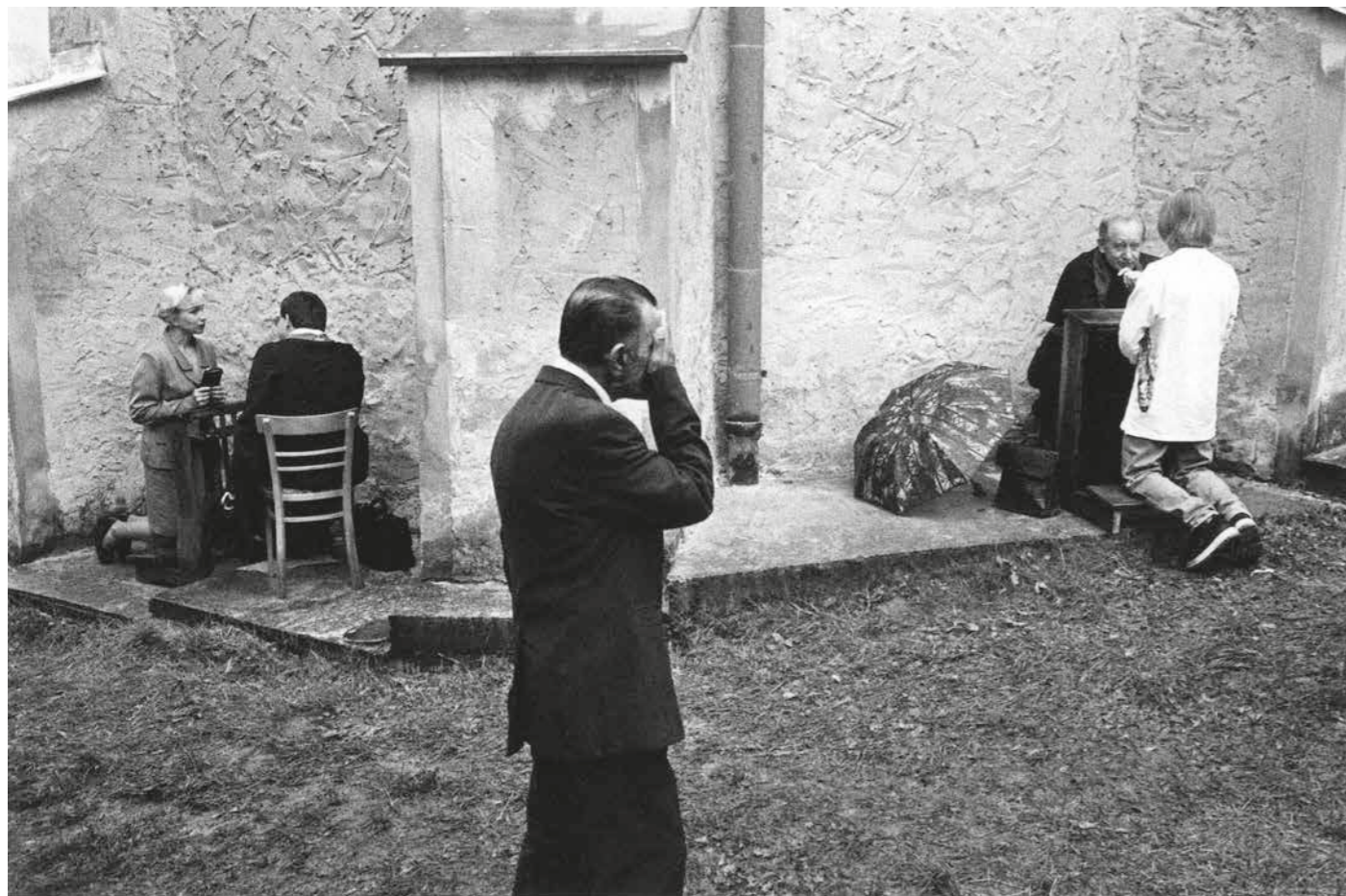
▲ Romská pouť, 1998–2018, Gaboltov, Slovensko. Foto: Jaroslav Pulicar. Ze sbírky Muzea romské kultury, F 9/2019