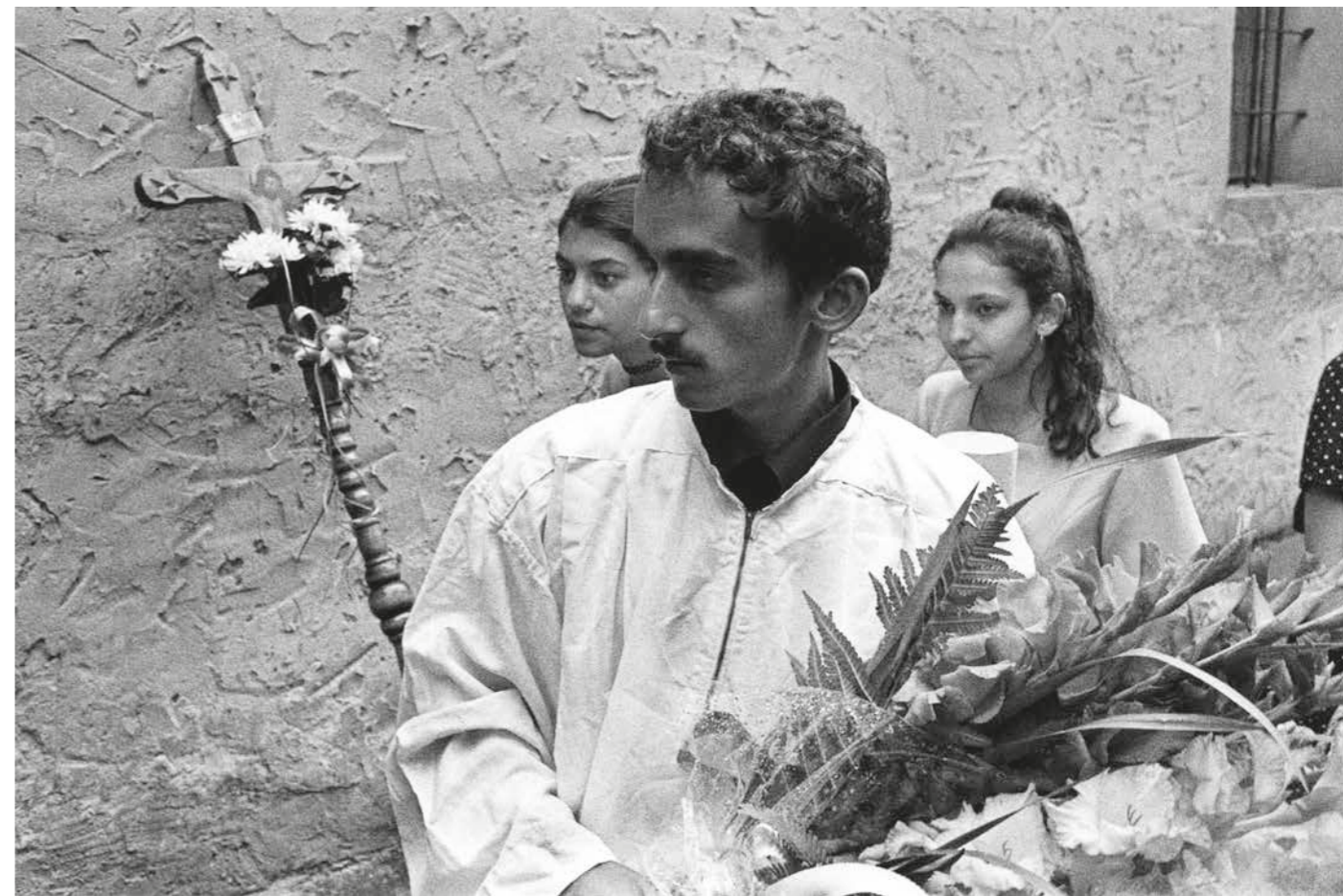
▲ Romská pouť, 1998–2018, Gaboltov, Slovensko. Foto: Jaroslav Pulicar. Ze sbírky Muzea romské kultury, F 9/2019