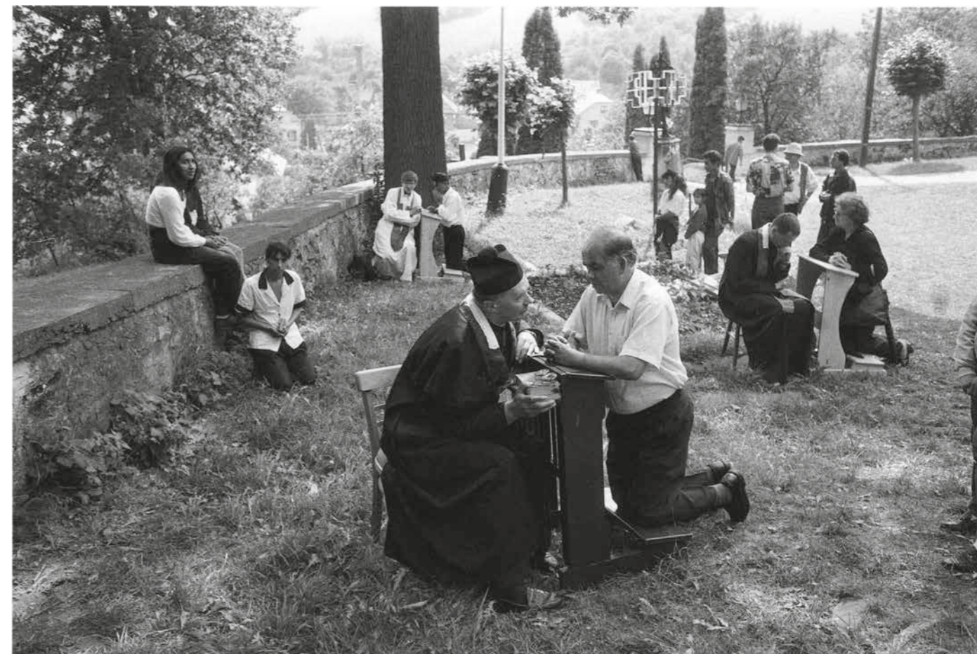
▲ Romská pouť, 1998–2018, Gaboltov, Slovensko. Foto: Jaroslav Pulicar. Ze sbírky Muzea romské kultury, F 9/2019

PULICAR, Jaroslav, POSPĚCH, Tomáš. 2020. Pulicar . Praha: Nakladatelství Tomáš Pospěch-PositiF.