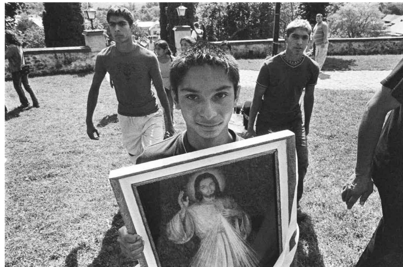
▲ Romská pouť, 1998–2018, Gaboltov, Slovensko. Foto: Jaroslav Pulicar. Ze sbírky Muzea romské kultury, F 9/2019