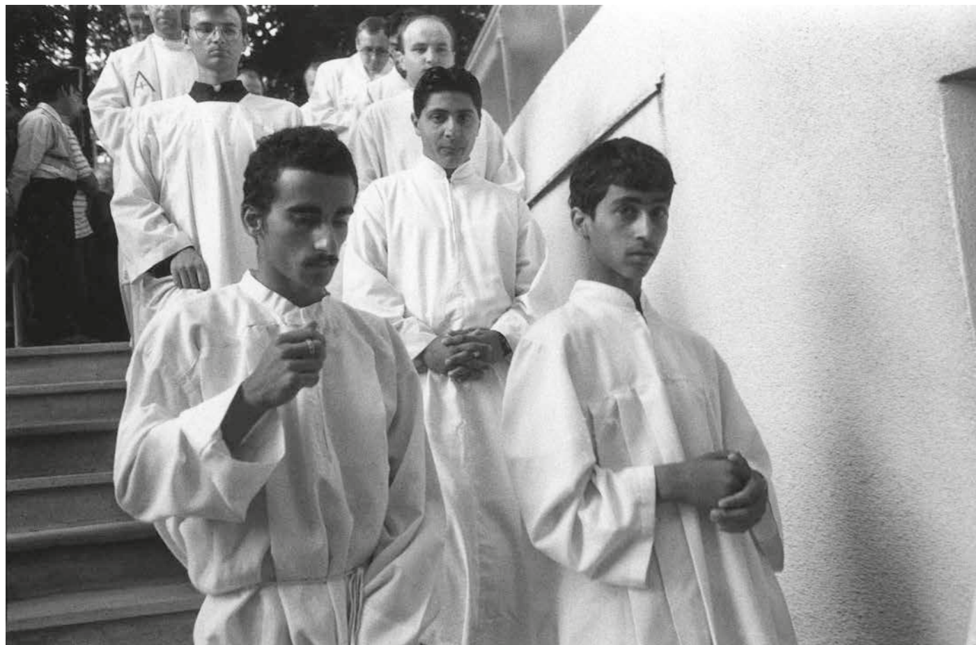
▲ Romská pouť, 1998–2018, Gaboltov, Slovensko. Foto: Jaroslav Pulicar. Ze sbírky Muzea romské kultury, F 9/2019