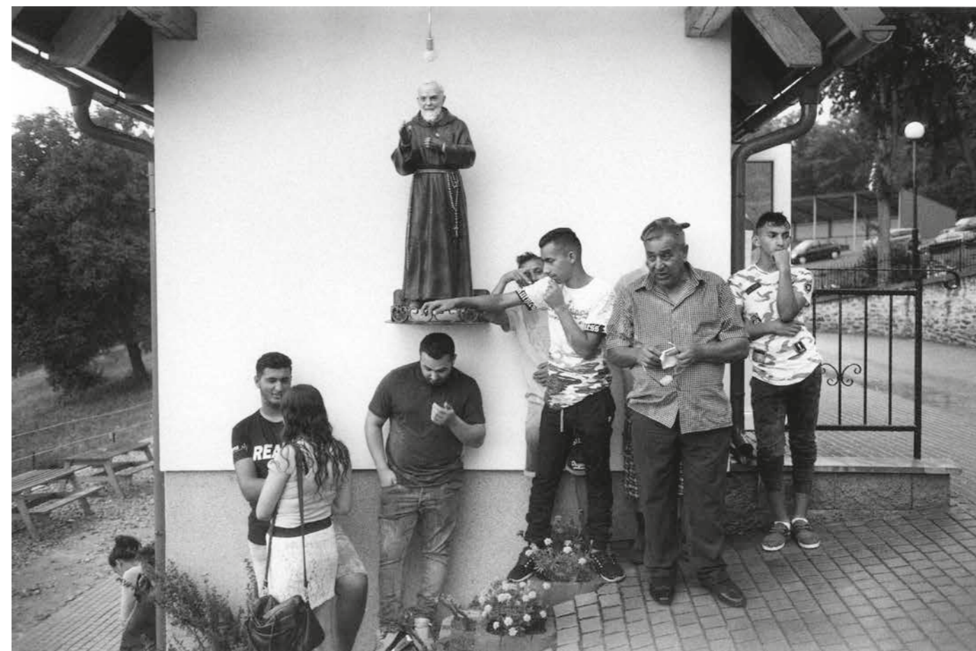
▲ Romská pouť, 1998–2018, Gaboltov, Slovensko. Foto: Jaroslav Pulicar. Ze sbírky Muzea romské kultury, F 9/2019