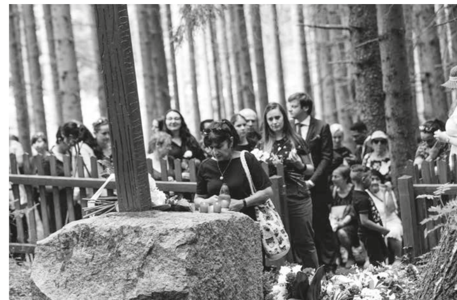
▲ Pietní akt k uctění památky obětí holokaustu Romů, 20. 8. 2020, Hodonín u Kunštátu.

Muzeum mělo v průběhu roku 2020 mnoho práce s realizací a vyhodnocením mezinárodní krajinářsko-architektonické soutěže o návrh Lety u Písku. Památník holokaustu Romů a Sintů v Čechách. Mimo mnohá další jednání se 3. 9. konal za přítomnosti MRK a autorů vítězného návrhu v obci Lety kulatý stůl se zastupiteli obce Lety a občany taktéž přilehlých obcí. Byla zde představena koncepce vítězného návrhu a současně i jeho začlenění do krajiny. Jednalo se o další ze série participativních setkání ke vzniku budoucí podoby památníku v Letech u Písku a prezentaci za přítomnosti společnosti ONplan lab a zástupců vítězů AS Lety.