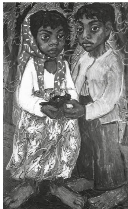
▲ Bohumila Doleželová, bez názvu, olejomalba na dřevěné desce, ze sbírky Muzea romské kultury, MRK 42/20