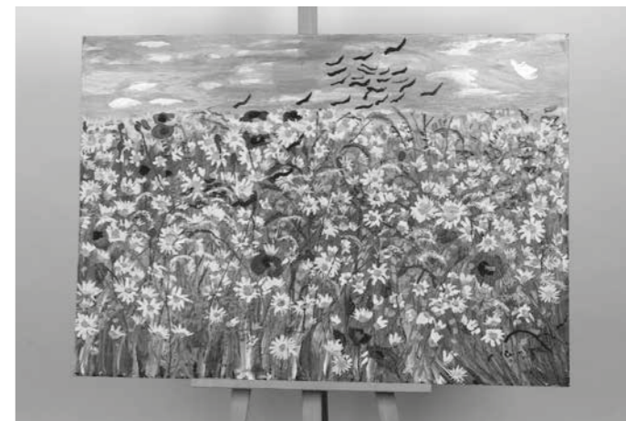
▲ Ceija Stojka, bez názvu (kopretiny s včelími máky), olejomalba na lepence, 1971, ze sbírky Muzea romské kultury, MRK 43/20