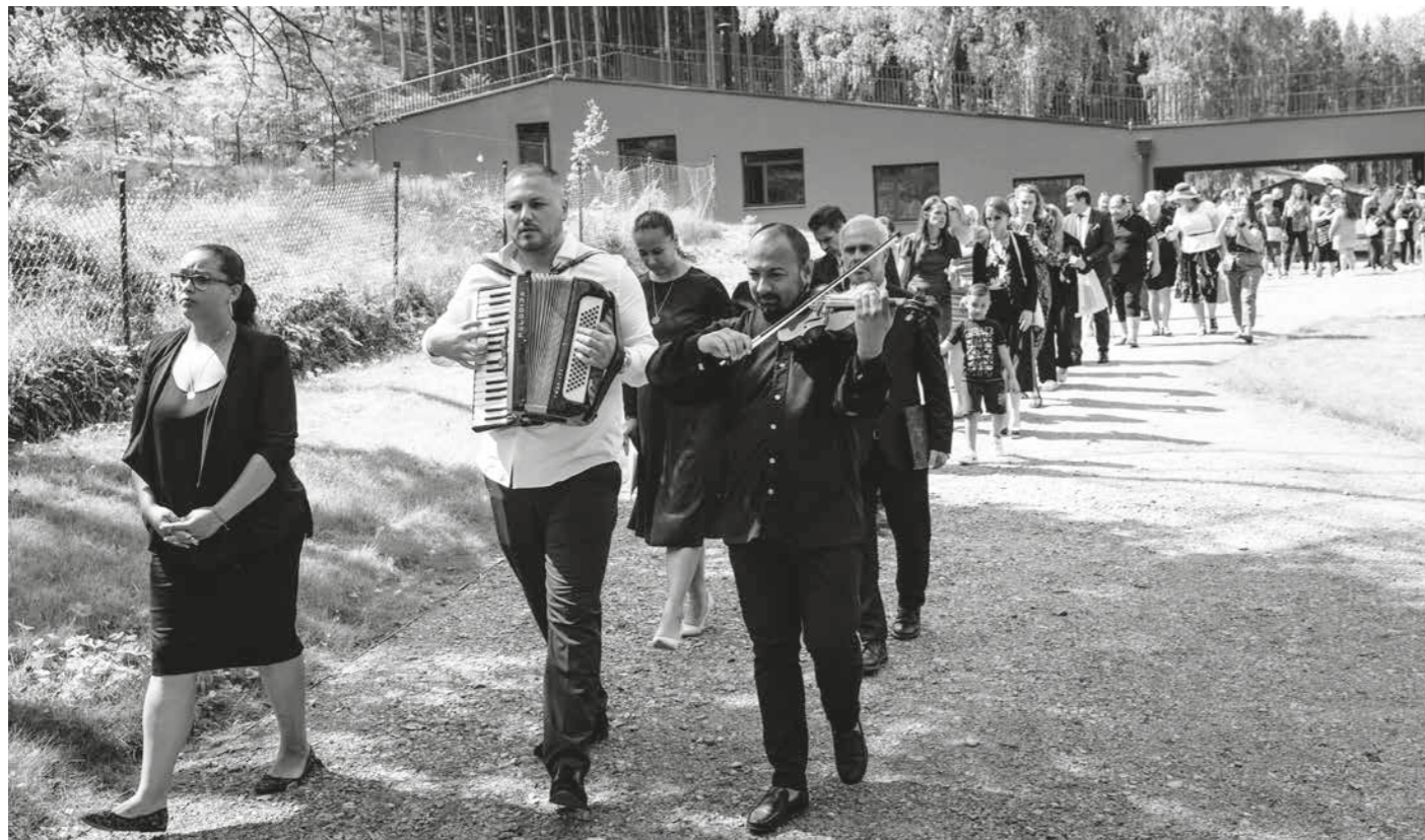
▲ Pietní akt k uctění památky obětí holokaustu Romů, 20. 8. 2020, Hodonín u Kunštátu.