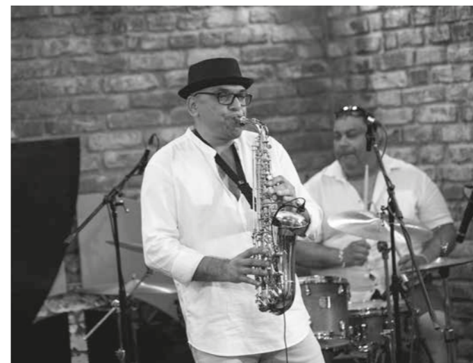
▲ Koncert hudební skupiny Gipsy Strings Teplice v rámci Summer stage MRK, 30. 7. 2020, Brno.