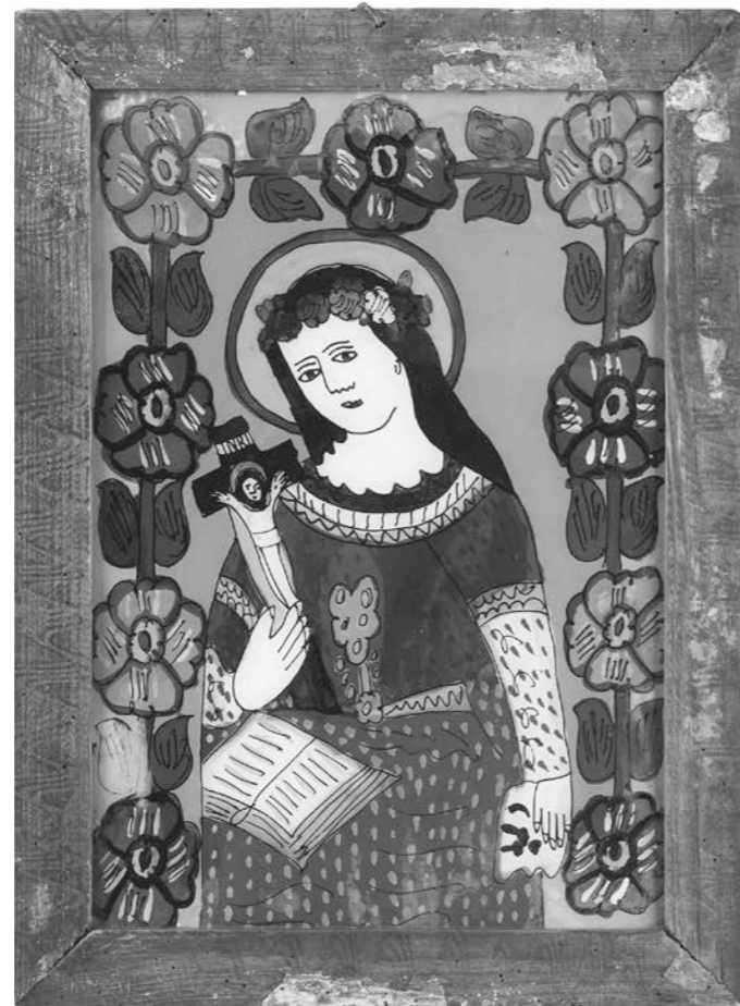
▲ Interiérová podmalba na skle, pravděpodobně z domácnosti rumunských Kalderašů, stav před restaurováním, ze sbírky Muzea romské kultury, MRK 28/2013