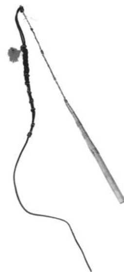
▲ Bič z majetku subetnika Kalderašů, oblast Fagaraš v Rumunsku, cca 1910–1930, ze sbírky Muzea romské kultury, MRK 91/20