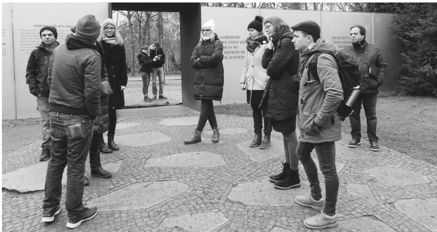
▲ Zástupci Muzea romské kultury s kolegy z Památníku zavražděných Židů před památníkem evropských Romů zavražděných během nacismu v Berlíně.

Ačkoliv nám pandemie výrazně zkomplikovala celé fungování projektu, jsme vděční Mezinárodní alianci pro připomínání holokaustu za finanční podporu. Díky zkušenostem načerpaným od kolegů ze zahraničí a z navštívených institucí jsme byli schopni lépe promýšlet jednotlivé aspekty expozice a dát si pozor na místa, která byla dle zkušeností kolegů problematická. Pomohlo nám to nastínit směr uvažování a také vytvořilo pevné kontakty s kolegy ze zahraničí, které třeba v budoucnosti povedou k hlubší spolupráci na dalších projektech.