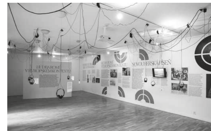
▲ Lavutara. Cestami romských muzikantů a jejich písní, 2019, Brno.