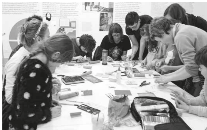
▲ Hudební workshop Už jsi vyráběl píšťalku?, 13. 2. 2020, Brno.

Edukační program pro školy k výstavě. Interaktivní a hravá forma žáky seznámila se základními fakty a příběhy týkajícími se romské hudby.