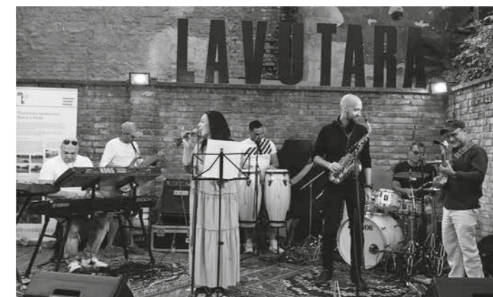
▲ Koncert funkové skupiny Aromasound v rámci Summer stage MRK, 23. 7. 2020, Brno.