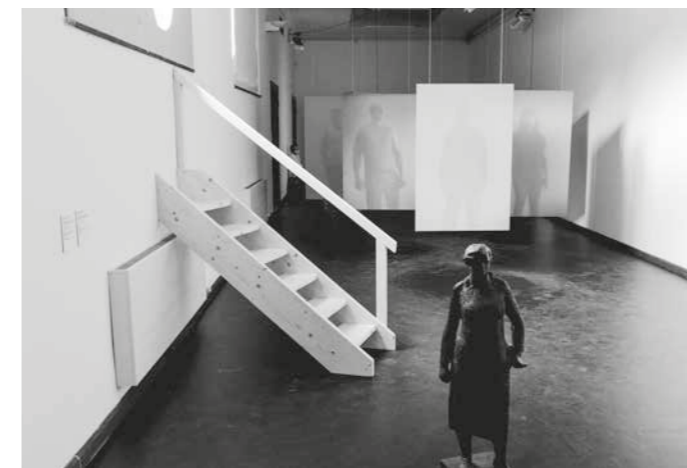
▲ Zahájení Bienále Ve věci umění – Pojd' blíž v GHMP, 21. 7. 2020, Praha.