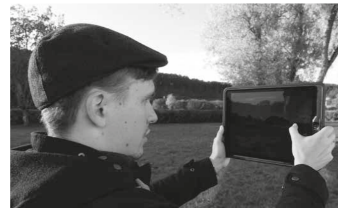
▲ Historik Dušan Slačka s tzv. rozšířenou realitou v památníku Falstad, Norsko.

Grant byl koncipován jako dvouletý, přičemž v prvním roce projektu (červenec 2019 – červen 2020) byly naplánovány cesty do zahraničí, které měly účastníkům přinést