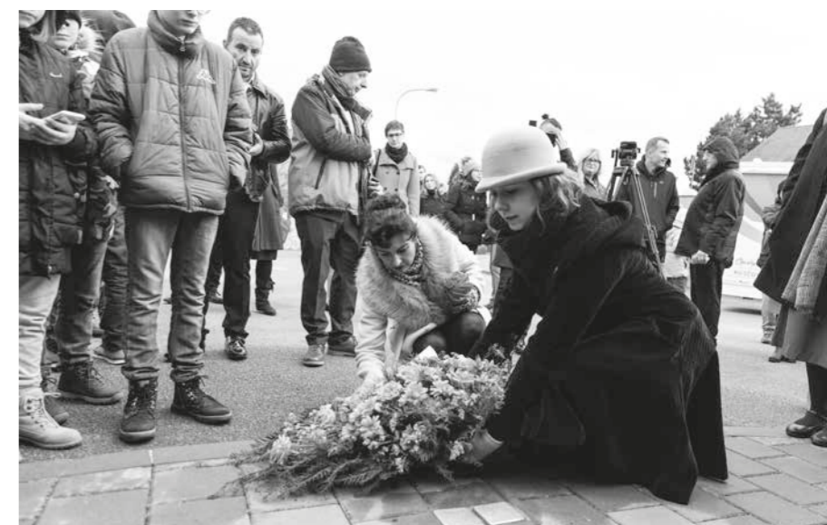
► Pokládání kamenů Stolpersteine v Brně-Žebětíně na místě vchodu do někdejší romské kolonie zvané Kolonka, 5. 3. 2020, Brno.