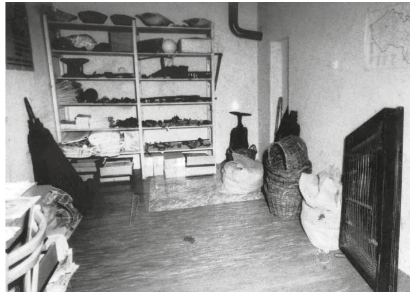
▲ Improvizovaný depozitář sbírky tradičních romských řemesel v sídle ÚV SCR v Brně. Foto z let 1969–1973.