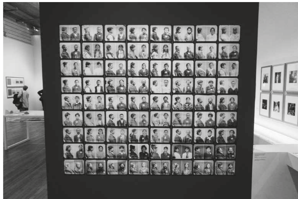
◀ Pohled do výstavy Mondes tsiganes, La fabrique des images, Une histoire photographique, 1860–1980 , květen 2018.

Nebylo by možné, aby ve výstavě chybělo téma období během světových válek. Během první světové války došlo ve Francii k zázkazu pohybu všech kočovně žijících osob. Romové podléhající mobilizaci se připojili k armádě a bojovali v přední linii po boku ostatních branců. Francouzské úřady pozatýkaly některé skupiny rakousko-uherských