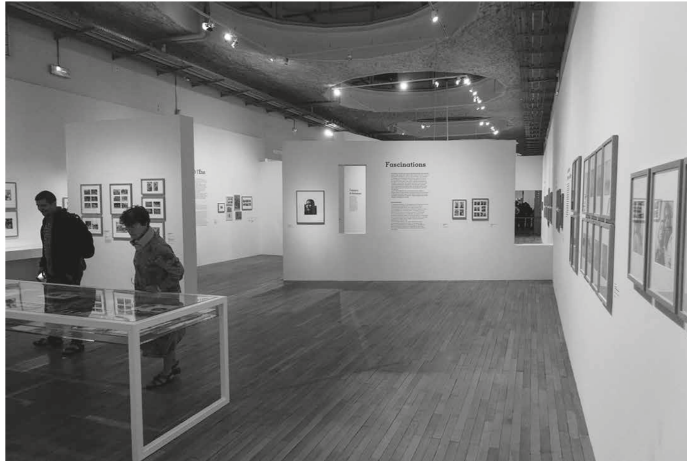
▲ Pohled do expozice Mondes tsiganes, La fabrique des images, Une histoire photographique, 1860–1980 , květen 2018.