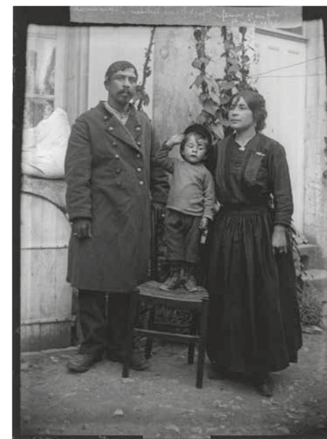
◀◀ Ukázka tištěných dobových periodik s romskou tematikou ve výstavě Mondes tsiganes, La fabrique des images, Une histoire photographique, 1860–1980 , květen 2018.