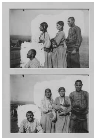
▲ Příklad fotografie zepředu a z profilu s viditelnou retuší, Dobruška – Rumunsko, cca 1899–1910.

ceměně chronologicky. Každé období/téma prezentované ve výstavě bylo uvedeno stručným textovým výkladem.